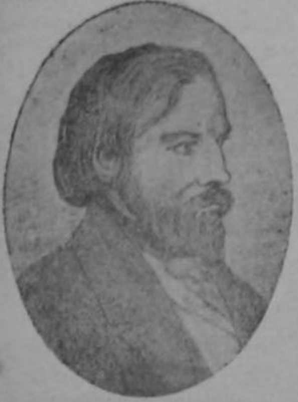
DON FEDERICO OZANAM,